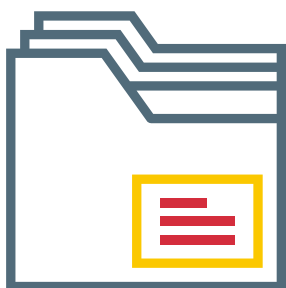
NOMBRE DE USUARIO IDENTIFICACIÓN

En el trabajo diario se requiere el acceso a distintos servicios, dispositivos y aplicaciones para los cuales utilizamos la dupla: usuario y contraseña. Garantizar la seguridad de estos es imperativo para la empresa y la primera medida de seguridad a tomar es utilizar contraseñas seguras.