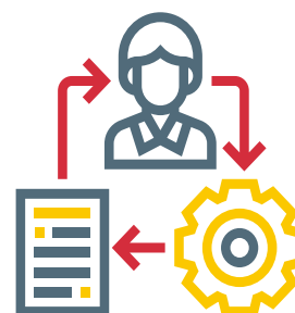
INICIO DE SESIÓN

En el control de accesos, el nombre de usuario nos identifica y la contraseña nos autentica, con ella se comprueba que somos quienes decimos ser. Todo sistema de autenticación de usuarios se basa en la utilización de uno, o varios, de los siguientes factores: